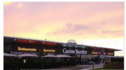
JULIEN PEREZ DS FO Blotzheim

Courage aux salariés qui voient leurs élections approcher. N'hésitez plus : Rejoignez Force Ouvrière !